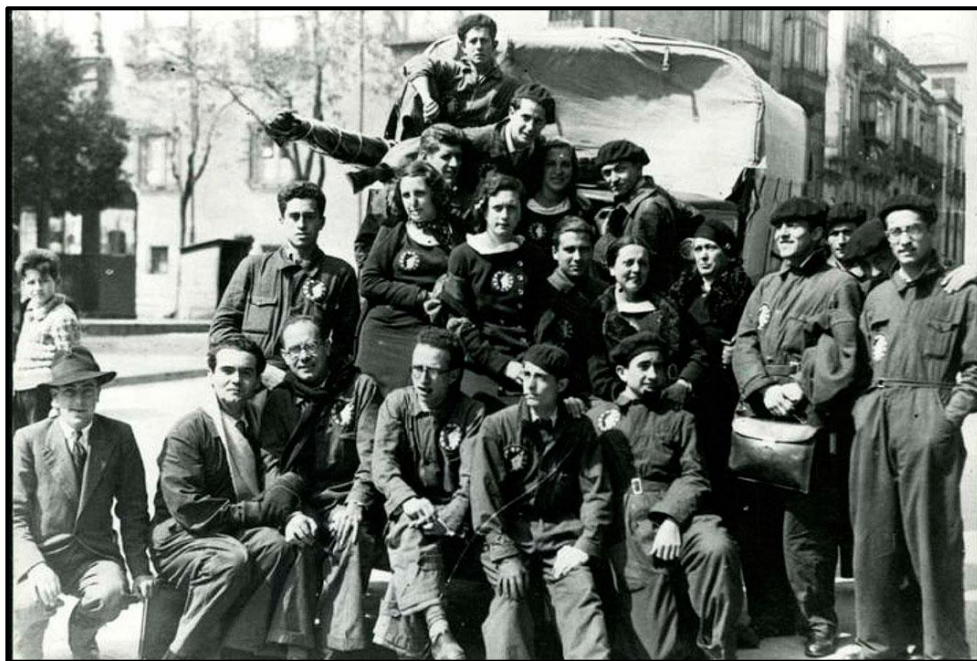
Lorca y los componentes de La Barraca en 1933

El Circular Truck pretende ser un centro experiencial sobre ruedas con el que poder concienciar y demostrar de manera interactiva los beneficios y la necesidad de evolucionar el presente modelo lineal a un modelo basado en la Economía Circular.